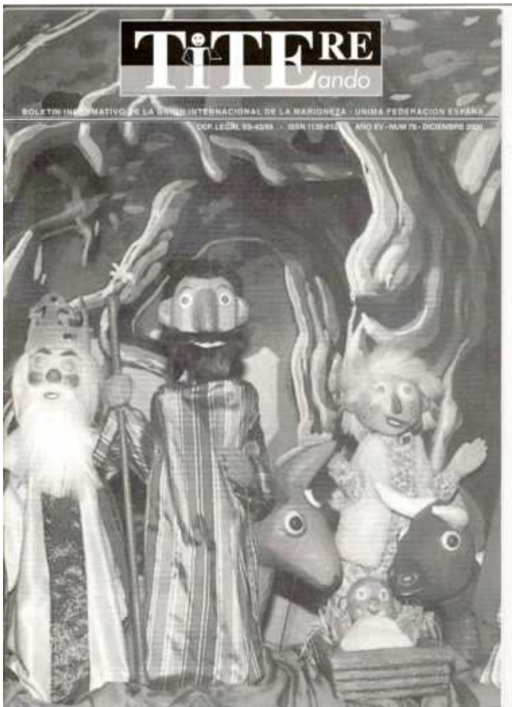
Portada de la revista especializada "TITEREANDO"