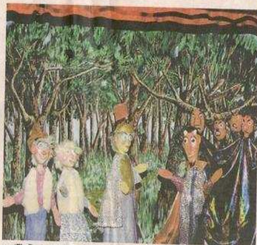
«Els Pastorets fum, fum, fum», en la Fundació Miró.

Anna de Vives. Tel. 93 476 86 00. Domingo, 12 h. «Concerts Familiars. El Messias» (fragment), de G. F. Händel; por la Orquestra Simfònica del Vallès - Coral Cantiga. Entrada, 500 ptas (20 ptes), 700 ptas. (1r piso) y 1.000 ptas. (galeries). Organiza Fundació La Caixa.